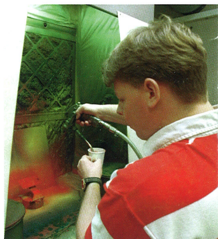
Färgen sprutas på en plåt.